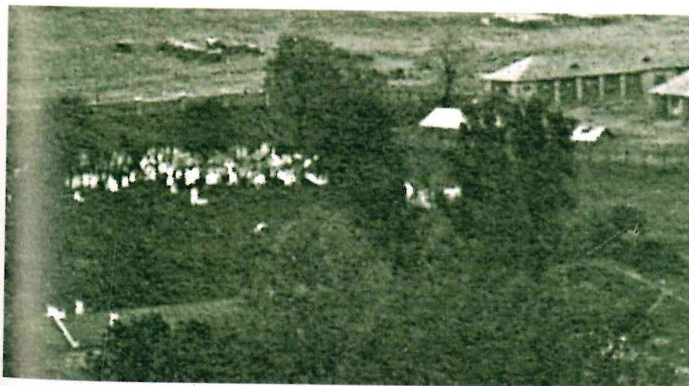
Вид на Старое кладбище с Замковой горы. Фотография неизвестного автора. 1915. VL