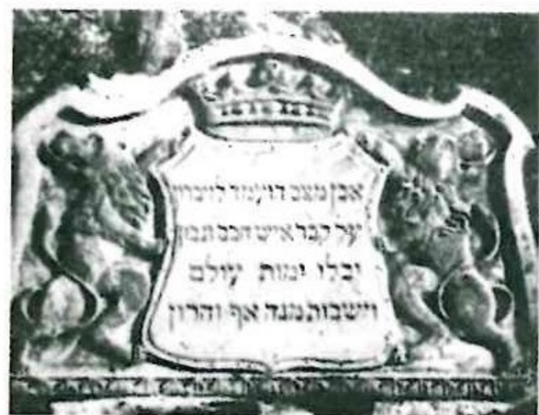
Надгробный памятник «мудрому и разумному человеку». Фрагмент. VŽMP 7574-2-12-1 N, ZE