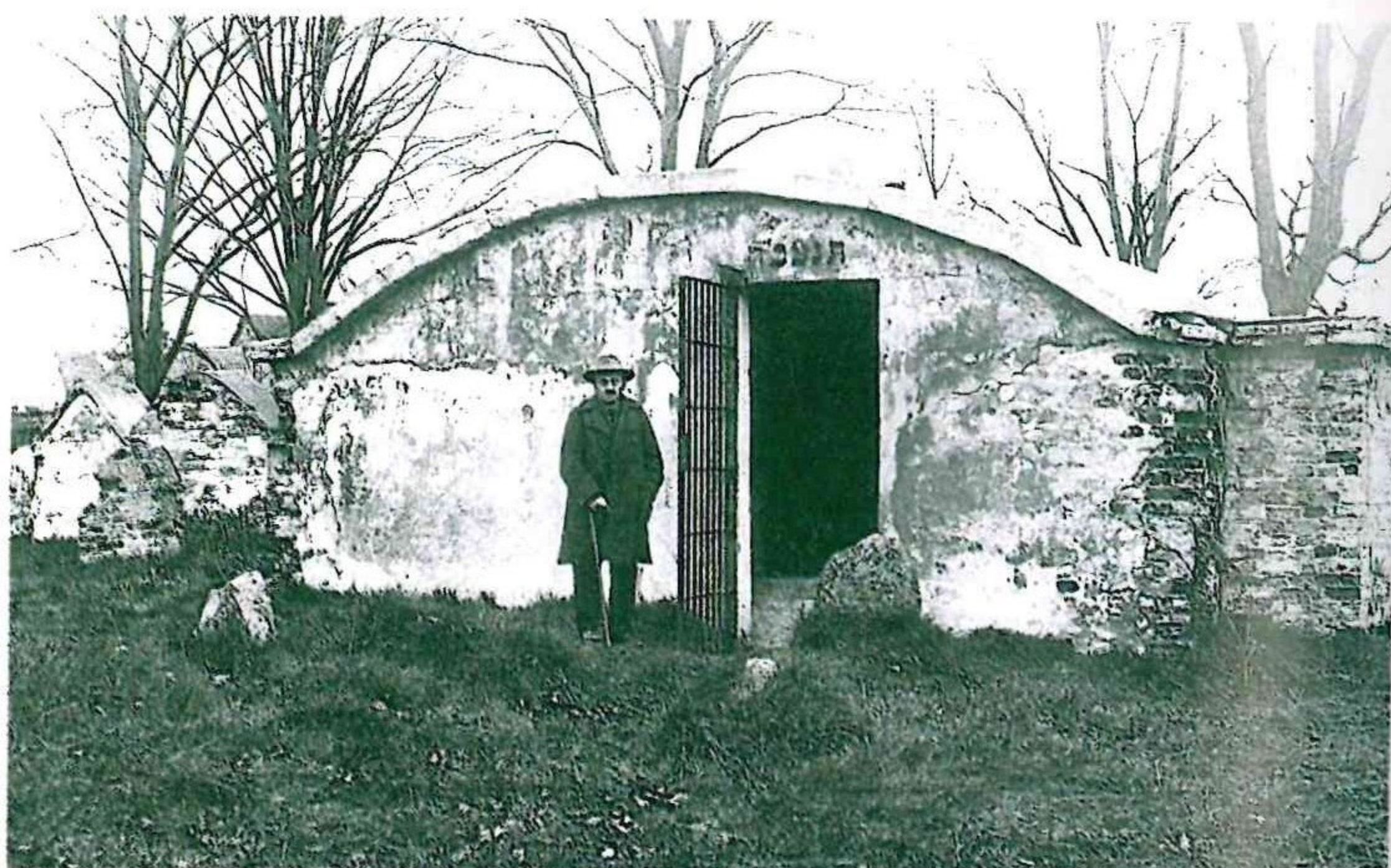
Гробница Гаона (вид с южной стороны). 1930-е.