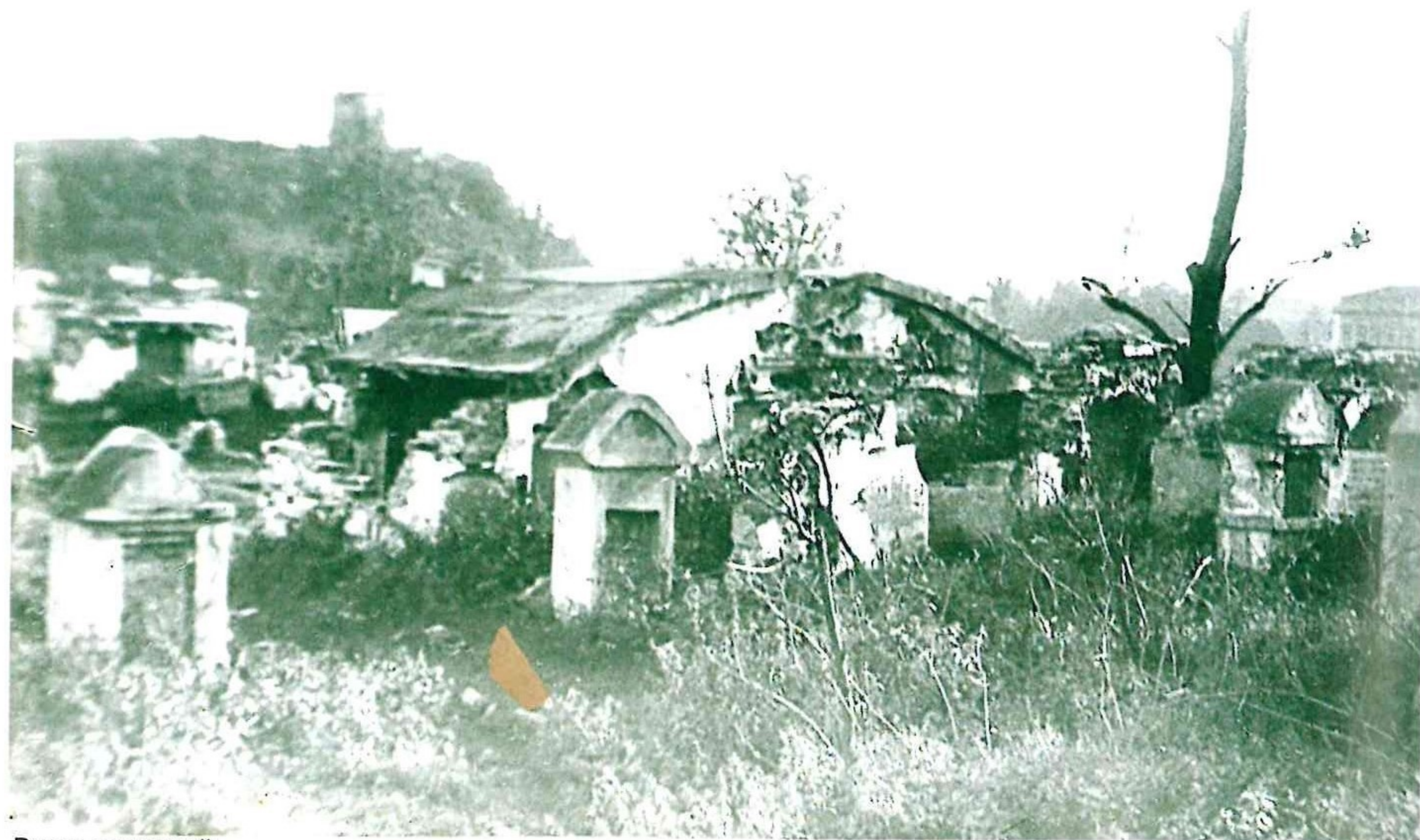
Вид с северной стороны кладбища. До 1950. VŽMP 3348