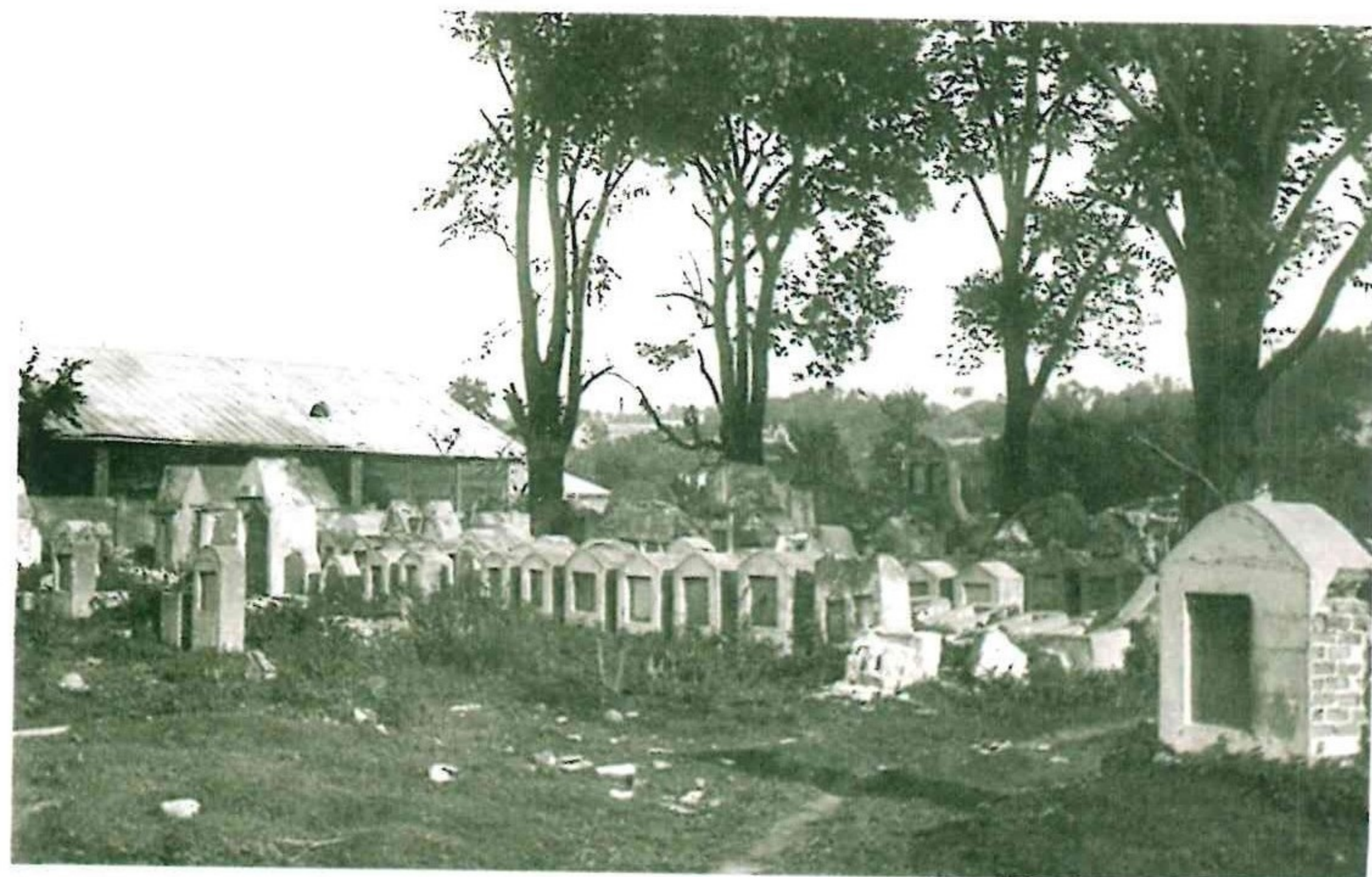
Восточная и северо-восточная (внизу) части Старого еврейского кладбища. До 1950. Фотографии неизвестного автора. VŽM 7854-177, -178